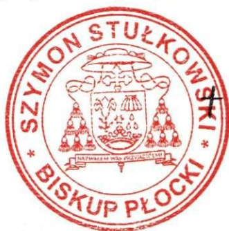
† Szymon Stułkowski Biskup Płocki